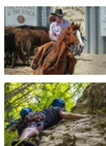
Organisator van een sportevent

Kies het soort bedrijf waarvoor je een merkbeleving wil creëren op en in jullie mobiele unit. Denk bijvoorbeeld aan: