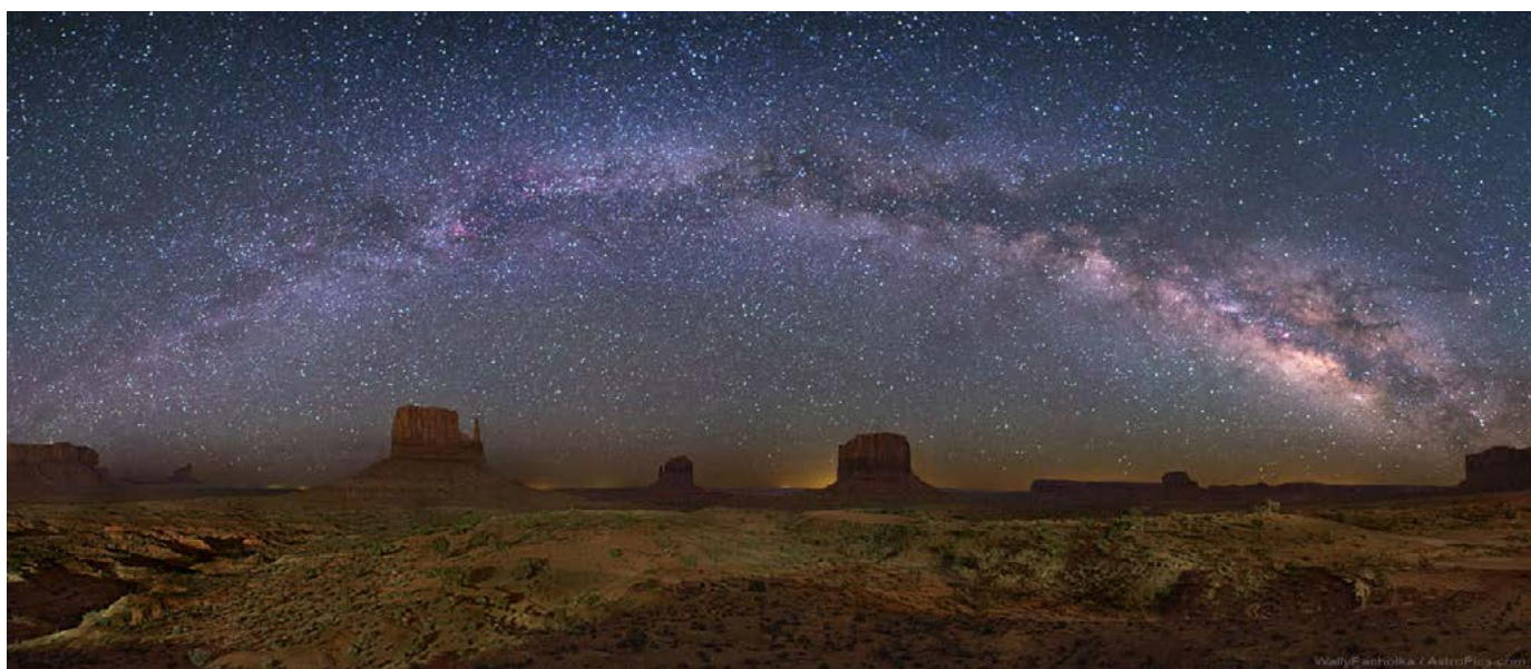
De Melkweg zichtbaar aan de nachtelijke hemel

De Melkweg is een spiraalvormig sterrenstelsel. De Melkweg heeft een doorsnede van ongeveer 100.000 lichtjaren. Een lichtjaar is een afstand van 9.460.800.000.000 kilometer (9,46 biljoen kilometer). Een afstand van 100.000 lichtjaren wil zeggen, dat het licht er 100.000 jaar over doet om van de ene naar de andere kant te reizen.