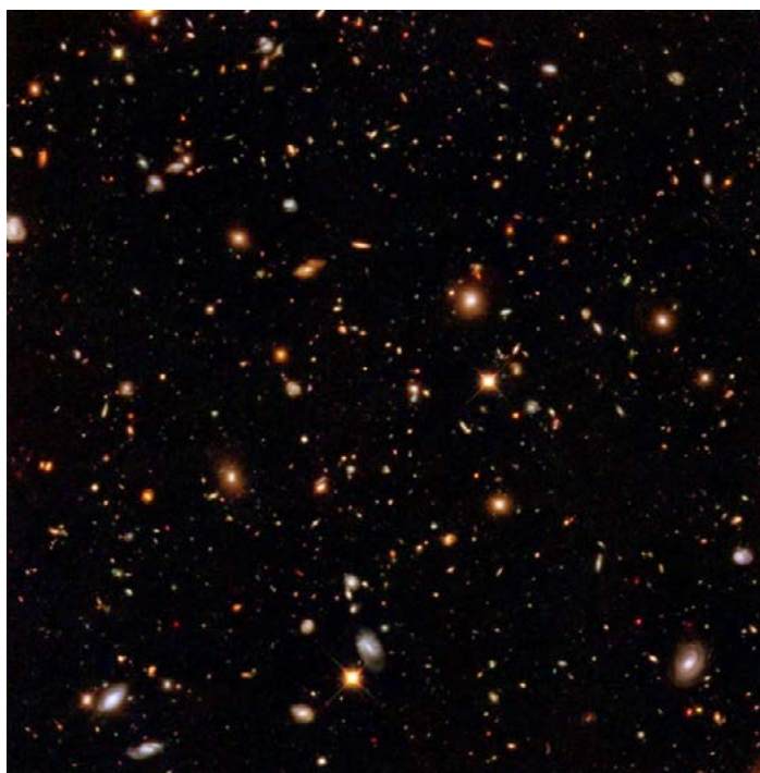
Een heel klein stukje heelal vol met sterrenstelsels gefotografeerd door de Hubble telescoop

Een mooie verzameling prachtige afbeeldingen van sterrenstelsel in de Hubble-telescoopgalerij: http://bit.ly/1r3V62P .