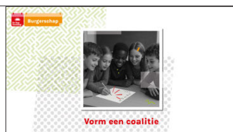
Slide 6 Maak een coalitie

Vertel: Tijdens de coalitievorming mag er geen contact zijn tussen de partijen. Bedenk zelf hoe streng je hierop wilt zijn. Stiekem dealtjes maken is ook onderdeel van de politiek.