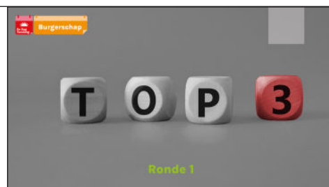
Slide 7 Ronde 1

Vraag: elke partijvertegenwoordiger om de top drie van hun partij voor te lezen.