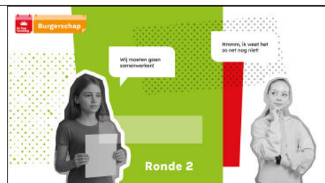
Slide 8 Ronde 2

Tijdens deze ronde mag elke partij een andere partij vragen om samen te werken. Begin bij de grootste partij. Die partij richt zich tot een andere partij en legt daarbij kort uit waarom zij denken dat het een goede samenwerking zou zijn. Vervolgens krijgen ook de andere partijen één voor één de beurt om een andere partij aan te wijzen waarmee ze willen samenwerken. Schrijf tijdens deze ronde op het bord welke partij welke andere partij heeft gevraagd.