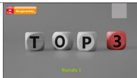
Slide 7 Ronde 1

Vraag: elke partijvertegenwoordiger om de top drie van hun partij voor te lezen.