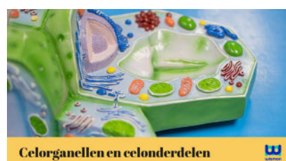
Celorganellen en celonderdelen