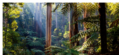
Het regenwoud verdwijnt