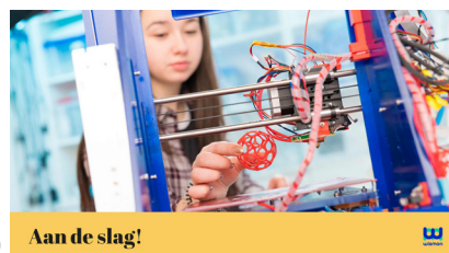
10 Aan de slag!